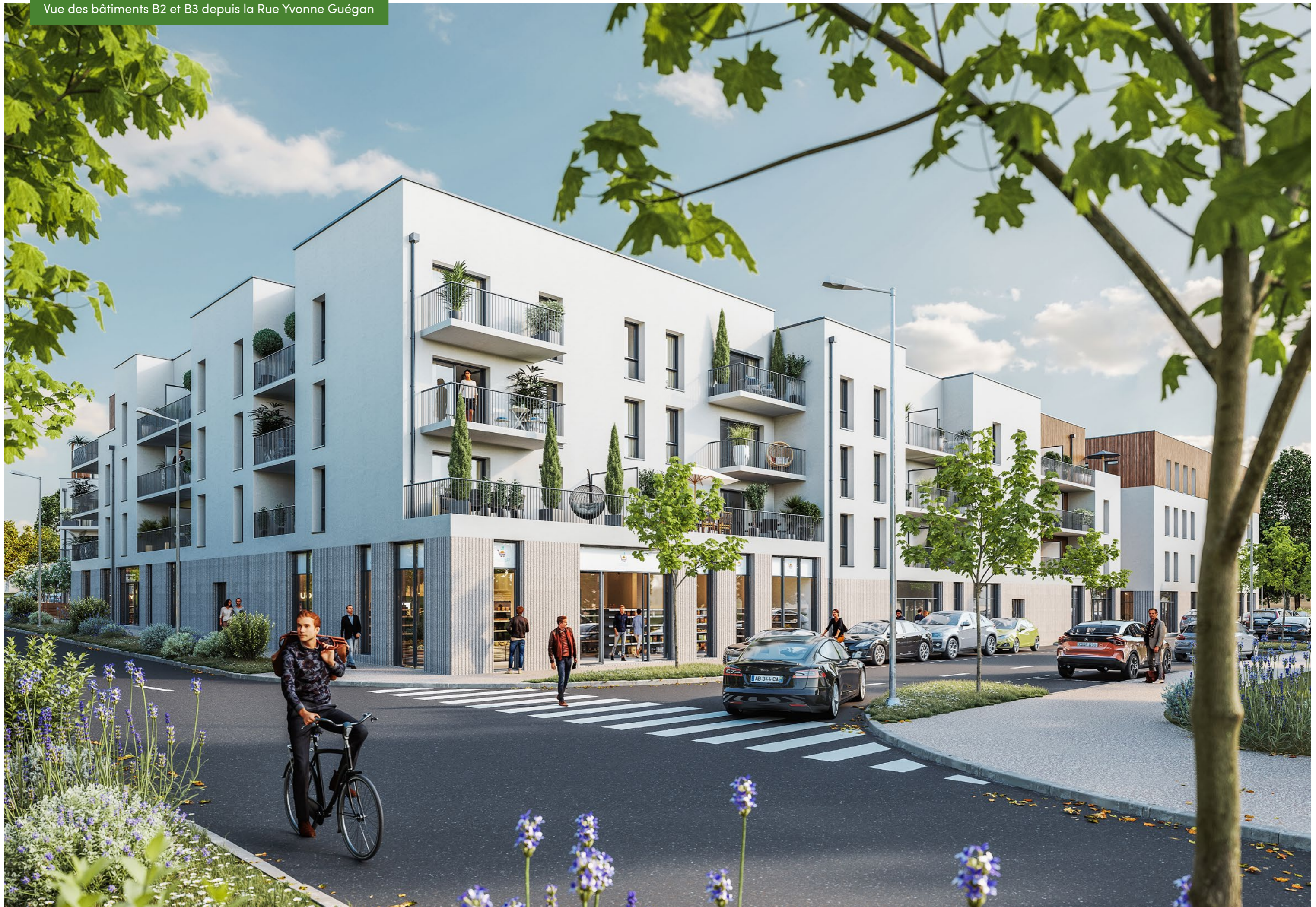
Vue des bâtiments B2 et B3 depuis la Rue Yvonne Guégan