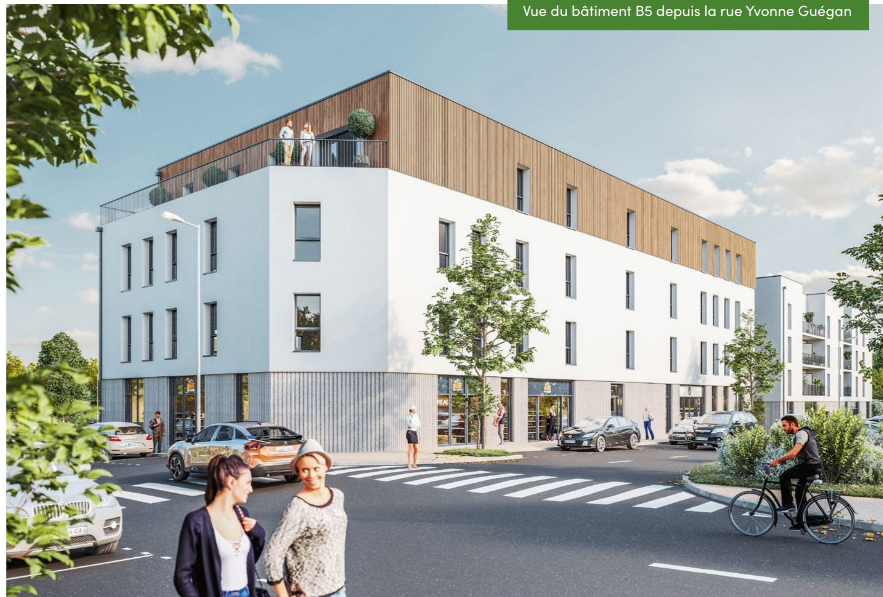
Vue du bâtiment B5 depuis la rue Yvonne Guégan