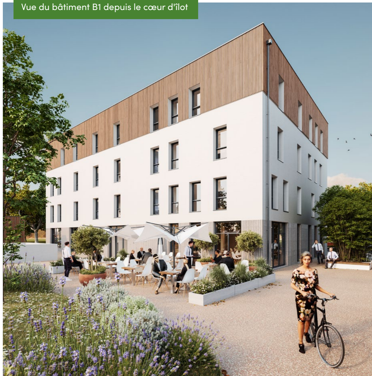
Illustration 3D non contractuelle.