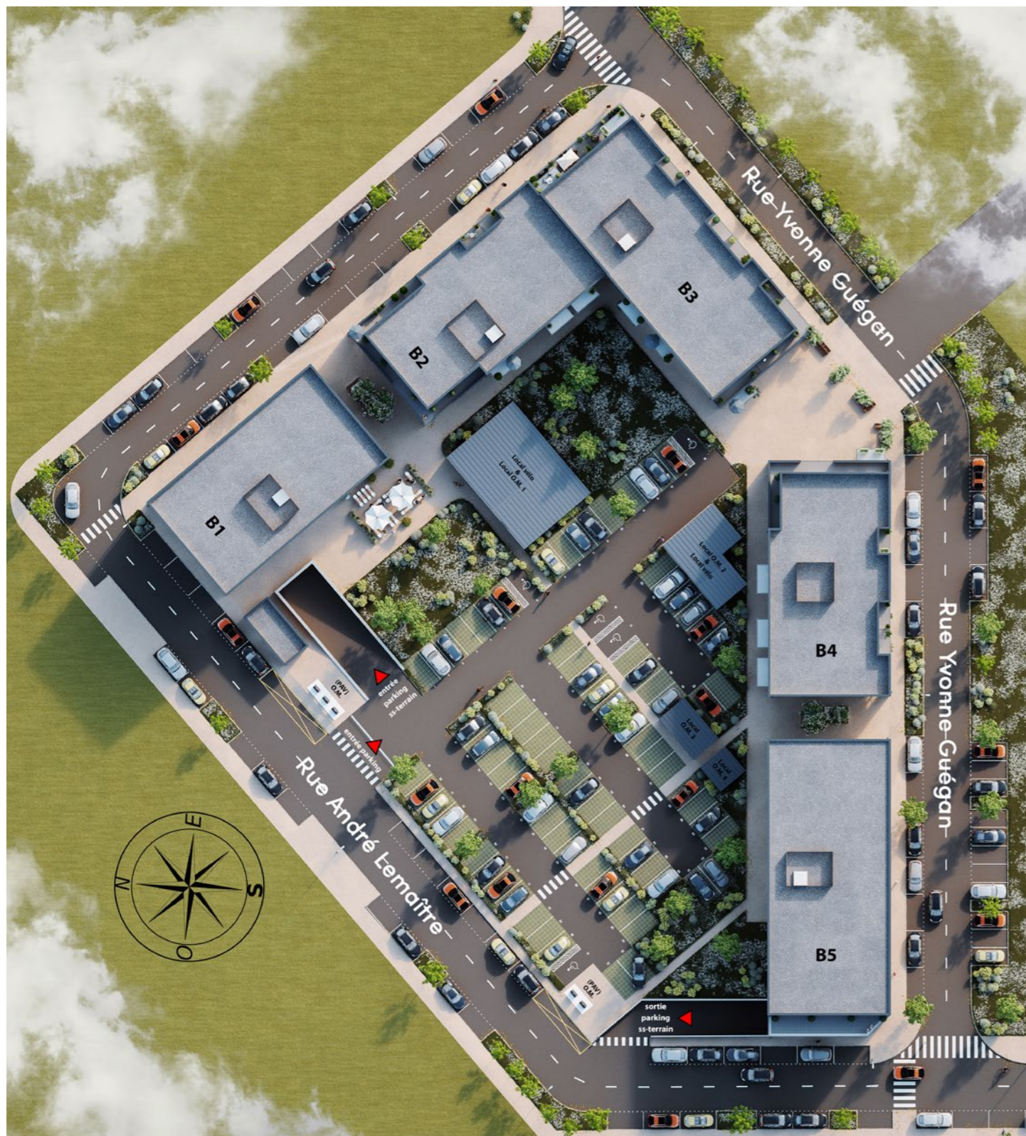
Illustrations 3D non contractuelles.