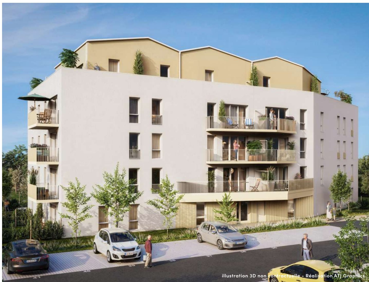
illustration 3D non contractuelle - Réalisation ATJ Graphics