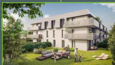
CLOS DU MARRONNIER