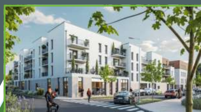
CŒUR DES CRÊTES