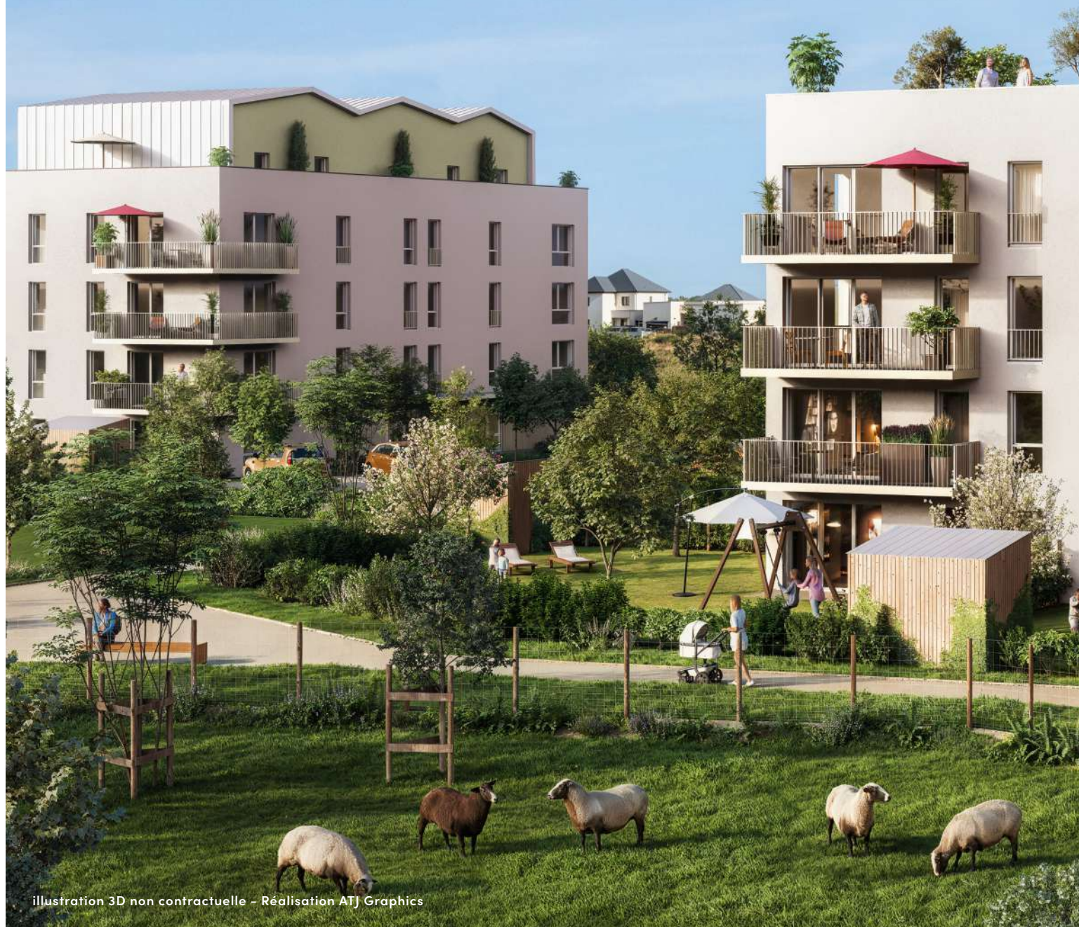
illustration 3D non contractuelle - Réalisation ATJ Graphics

Chaque bâtiment dispose d'un ascenseur et d'au moins une place de parking pour chaque logement.