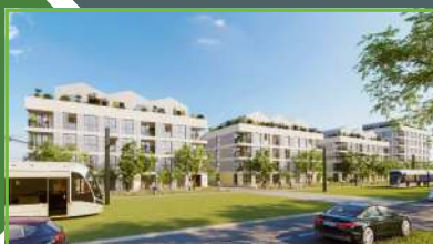
TERRASSES DE L'ÉTANG