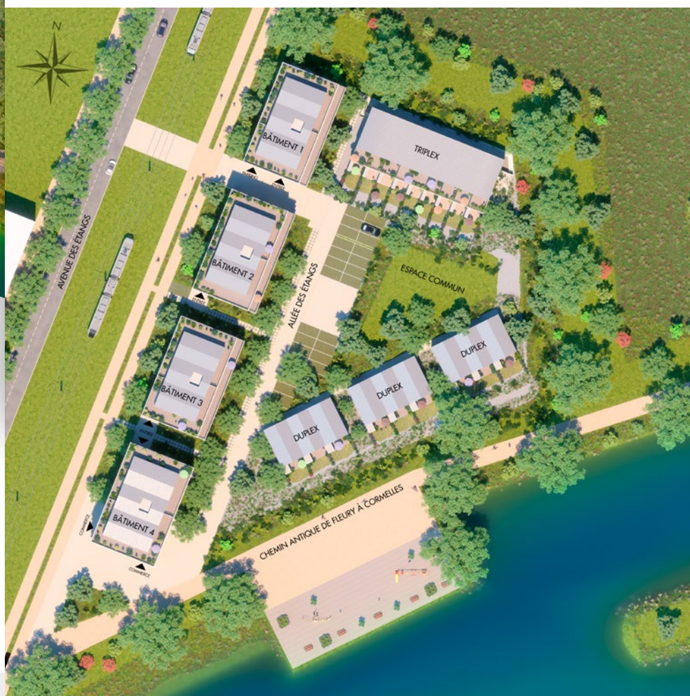
Vue axonométrique et plan masse du programme.